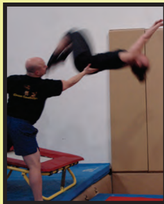
Perfectionnement de l'acteur physique : Entraînements

« En plus de développer l'autonomie et la détermination, la rigueur et la persévérance, la particularité du programme de jeu acrobatique est de compléter et d'enrichir les habiletés de chacun : le jeu chez les acrobates, le mouvement chez les acteurs. Le programme a toujours pour but de combler les lacunes, de faire se rencontrer le jeu de l'acteur et le mouvement. »