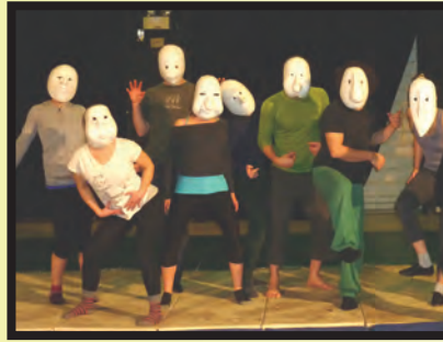
Perfectionnement de l'acteur physique : Stage 2 - Le jeu masqué

« En termes de contenu, le programme est resté sensiblement le même, dit Pierre Leclerc, avec deux stages de jeu d'acteur et 210 heures de formation acrobatique. Au début, nous proposions trois stages, mais notre budget ne nous le permet plus.