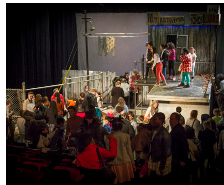
Visite des coulisses - Événement-bénéfice Mars 2016