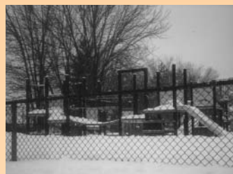
Une des idées de départ du spectacle Lili : la cour d'école qui inspirera la scénographie

Comme on ne peut s'appuyer au départ sur aucune référence, tout est à inventer. En quatre productions, une méthode de travail se dessine. La place de l'auteur dans le processus de création se précise. Le partage des rôles entre les metteurs en scène et l'auteur se précise pour mieux s'équilibrer. Aujourd'hui, la création d'un spectacle se joue en quatre ou cinq étapes de travail qui procèdent d'un lent processus de maturation qui varie entre deux et trois ans.