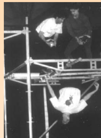
Travail de recherche d'écriture du mouvement par les interprètes