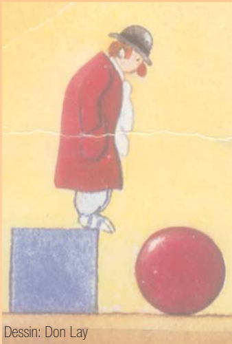
Dessin: Don Lay